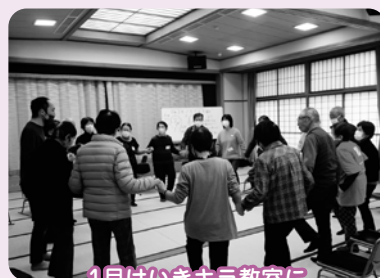
1月はいきいき教室に参加しました

小物作りやレクリエーションで気分転換をし、おしゃべりを交えて楽しいひとときを過ごしませんか？尚、申込みはすべて一回ごとです。町内どこからでも送迎します。その他ご不明な点がございましたらお気軽にお問合せください。