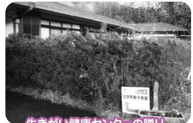
生きがい健康センターの隣り、 ちびっ子ハウス内で活動をしています。